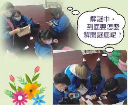
解謎中，到底要怎麼解開謎底呢？