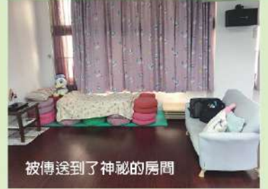
被傳送到了神秘的房間