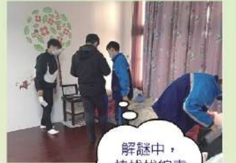
解謎中，快找找線索在哪裡吧！