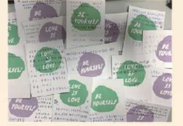
學生寫下對跨性別者的鼓勵