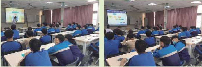
同學們仔細聆聽，為自己的未來做準備

由虎科大進修推廣部推廣教育中心主任，帶領電機工程系、光電工程系、機械與電腦輔助工程系三位系主任，以及合作的廠商，一同前來向高三同學們說明產學訓專班、產學攜手合作專班、進修部等學制，讓同學們認識不同的升學進路，提供畢業之後，在升學與就業之間的第三種選擇。能夠兼顧課業及工作，在大學就學期間，同時有穩定的工作，為自己儲備更多資源，選擇更好的未來。