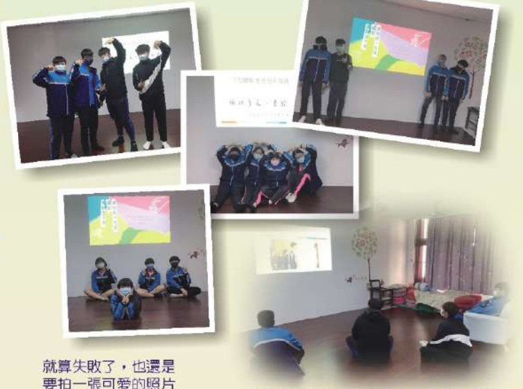
就算失敗了，也還是要拍一張可愛的照片

這次的性平週的副標題是—你知道做自己需要多大的勇氣嗎？輔導室希望透過這次的體驗活動設計，除了增加同學們對跨性別者的認識外，也希望能夠鬆動大家心中對於性別氣質的框架及刻板印象，男生不一定要陽剛，女生也不一定只能溫柔。不管是什麼性別，有著什麼樣的性別氣質，都能夠自由自在的尊重與欣賞自己與他人的不同，每一個不同都是獨一無二且美好的。一起擁抱每個多元而真實的彼此，勇於不同，期待每個獨一無二的你/妳，都能夠做真實的自己，並且喜歡這樣的自己。