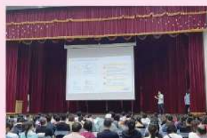
學習歷程檔案家長說明會-教務處註冊組