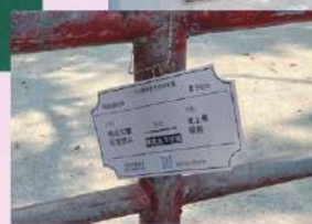
藏身校園各角落的車票