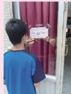
同學闖關及閱讀車票故事